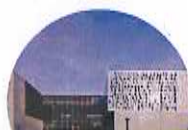
ARRÊT MÉDIATHÈQUE : la médiathèque