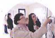
ARRÊT FORUM : La gare routière