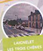
LAIGNELET LES TROIS CHÊNES