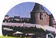
ARRÊT CARNOT : le marché de Fougères + commerces / centre-ville